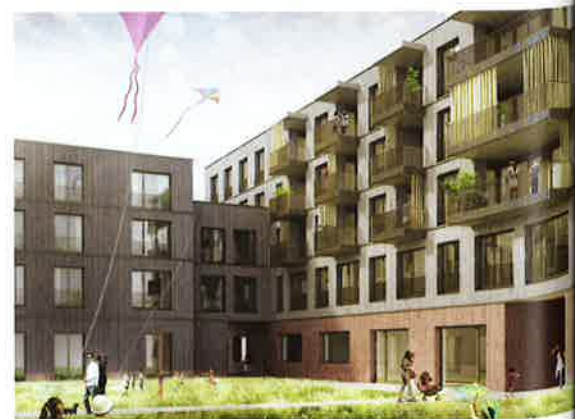
Betreutes Wohnen über der Kinderkrippe im Bau 1 von Galli Rudolf. Rendering: Atelier Brunecky, Zürich