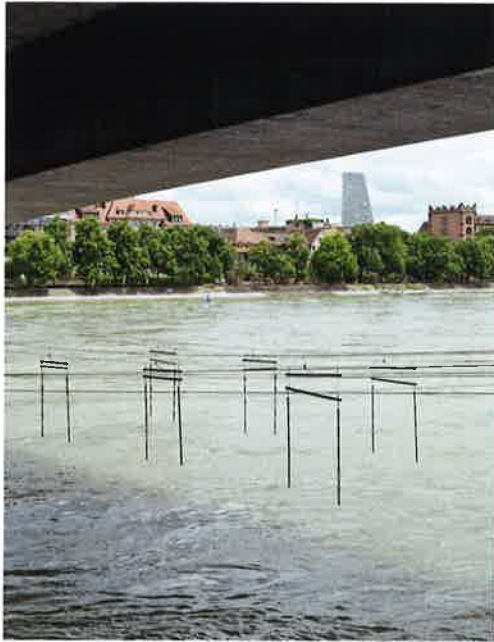
Im Schatten der Dreirosenbrücke. Die Stadtansichten des Fotografen Beat Aemmer führen durch dieses Heft.

Thomas Aemmer (1982) lebt in Interlaken. Er hat den Lehrgang Fotodesign an der Berufsschule für Gestaltung in Zürich absolviert. Seit 5 Jahren arbeitet er schweizweit als selbstständiger Fotograf mit Fokus auf Dokumentar-, Interior- und Architektur-Fotografie. Dabei stehen stets der Bezug zum Menschen oder dessen Wirken im Mittelpunkt. Alle seine Fotos vereint ein subtiler Hang zur Ironie. Uns hat besonders seine Bildstrecke «Künstliche Natürlichkeit» ( thomasaemmer.alloyou.net ) überzeugt, ihn mit dem Streifzug durch Basel zu beauftragen.